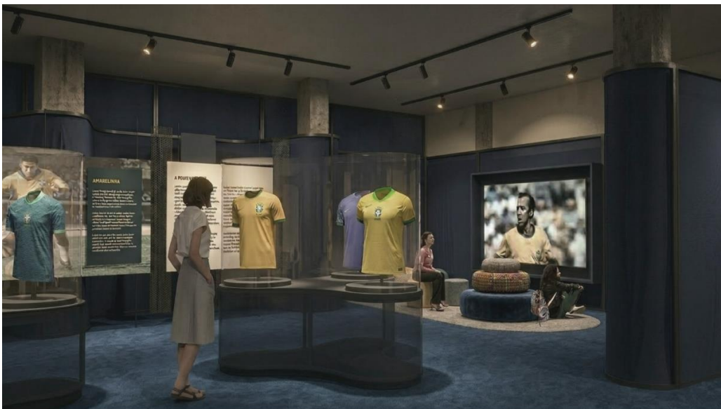
Vista 3d referencial da exposição

Incluir manutenção eventual para troca de lâmpadas queimadas e manutenção da afinação.