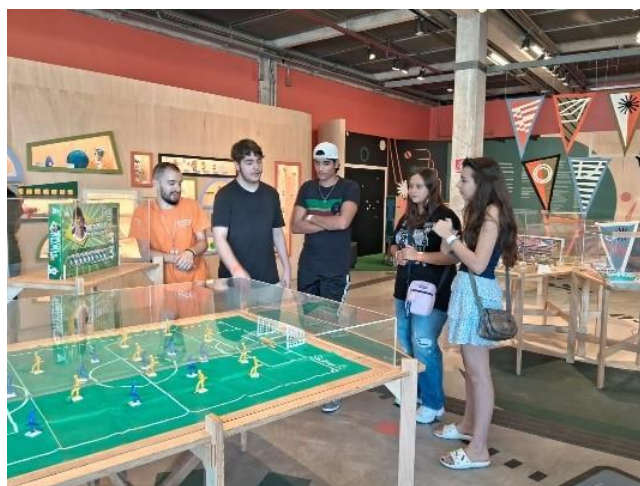
Visita mediada com público espontâneo

A meta não foi realizada em sua totalidade. Avalia-se, que a exposição temporária 'Futebol de Brinquedo' estimula visitas com perfil mais autônomo, apesar do visitas mediadas terem sido oferecidas ao público. Sendo assim a maior parte do público espontâneo demonstrou interesse em visitar a exposição de forma autônoma, sem mediação, e participar das atividades que complementam a exposição, oferecidas na área externa.