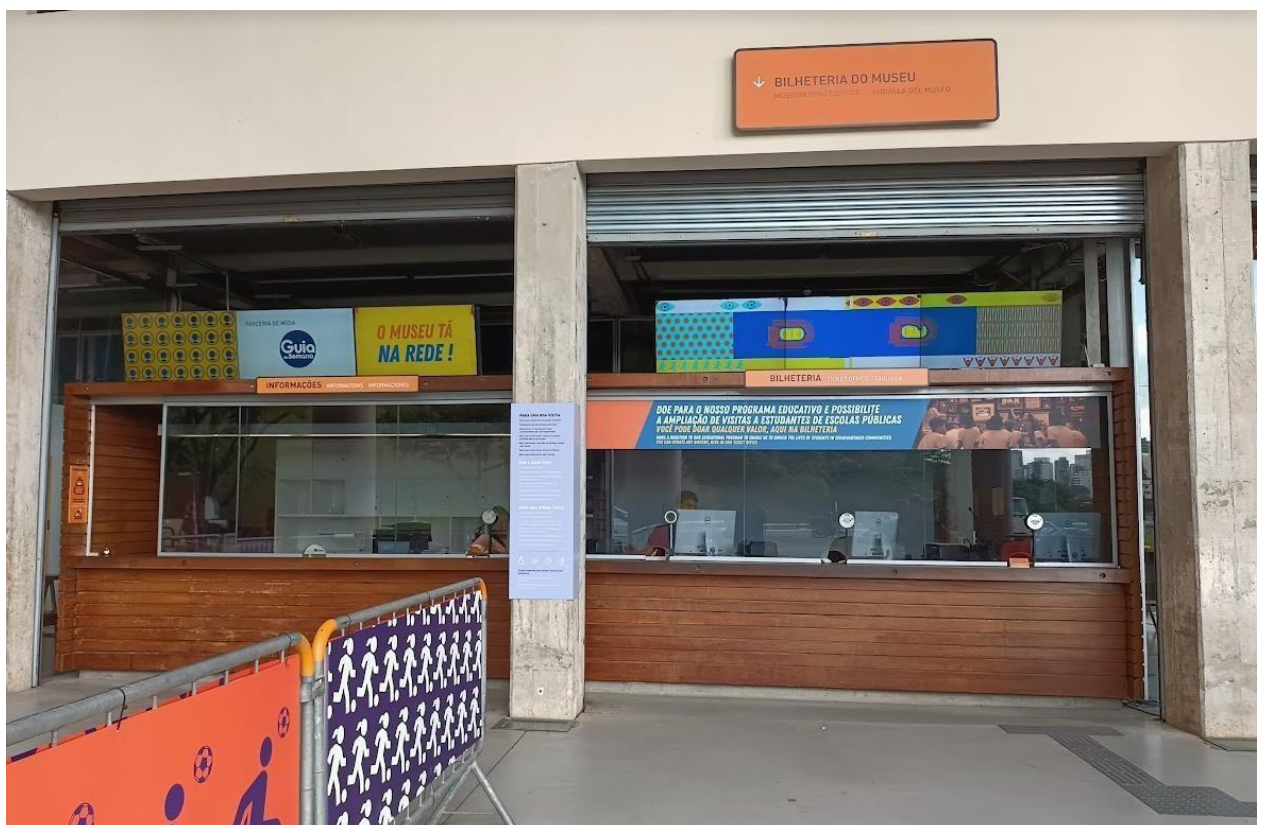
Figura 1 - Aspecto geral da bilheteria

A bilheteria do Museu do Futebol é composta por estrutura de madeira, com área útil de aproximadamente 37m 2 , inserida em área construída do estádio do Pacaembu. O escopo da reforma contempla a adaptação interna e externa para acessibilidade da bilheteria, bem como a manutenção da estrutura de madeira.