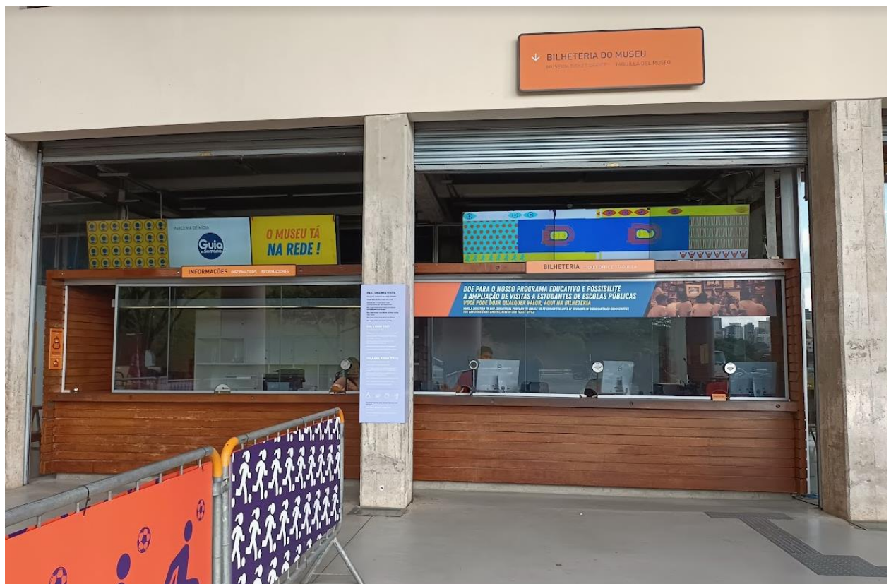
Figura 1 - Aspecto geral da bilheteria

A bilheteria do Museu do Futebol é composta por estrutura de madeira, com área útil de aproximadamente 37m 2 , inserida em área construída do estádio do Pacaembu. O escopo da reforma contempla a adaptação interna e externa para acessibilidade da bilheteria, bem como a manutenção da estrutura de madeira.