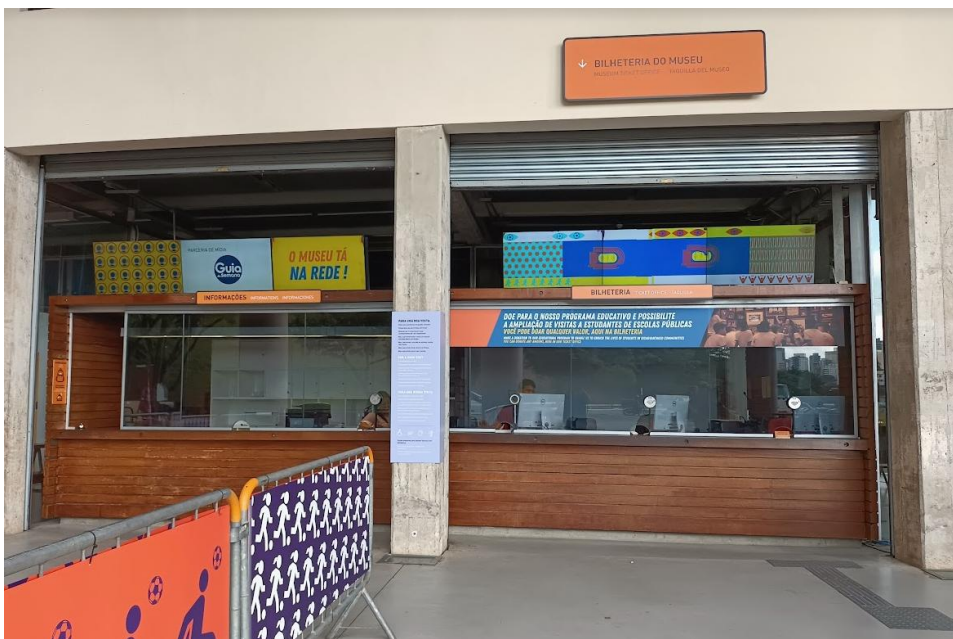
Figura 1 - Aspecto geral da bilheteria

A bilheteria do Museu do Futebol é composta por estrutura de madeira, com área útil de aproximadamente 37m 2 , inserida em área construída do estádio do Pacaembu. O escopo da reforma contempla a adaptação interna e externa para acessibilidade da bilheteria, bem como a manutenção da estrutura de madeira.