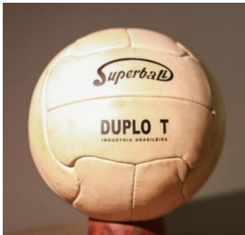
Imagem de referência:

Objetivos: Réplica de bola utilizada nos anos 1950 no Brasil. Essa bola tem como premissa a costura à mão, o fechamento da câmara interna de ar com válvula externa para enchimento e o revestimento da bola em couro, ainda permeável. A instalação da obra estará em uma mesa apropriada para tanto, com uma cavidade circular de encaixe para fixação com 13 cm de diâmetro. A diferença deve estar na composição material do couro e na câmara interna de ar, já de borracha.