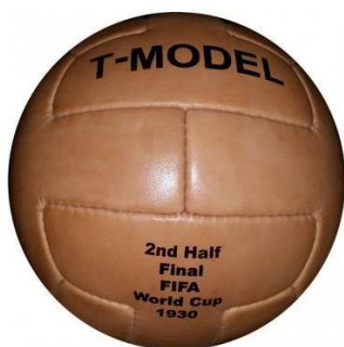
Imagem de referência:

Objetivos: Réplica de bola utilizada no início da prática do futebol no Brasil. Essa bola tem como premissa a costura à mão, o fechamento da câmara interna de ar com cadarço e o revestimento da bola em couro. A instalação da obra estará em uma mesa apropriada para tanto, com uma cavidade circular de encaixe para fixação com 13 cm de diâmetro. A diferença deve estar na composição material do couro e na câmara interna de ar, já de borracha.