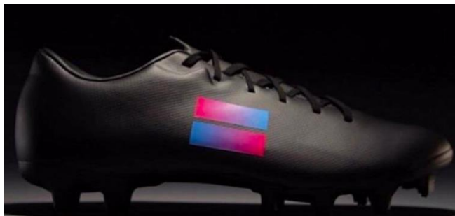
Imagem de referência:

Objetivos: Réplica de chuteira de futebol utilizada por jogadoras. Essa chuteira tem como premissa a utilização de materiais sintéticos duráveis, leves e resistentes à água. O seu formato é projetado para ser anatômico, de modo a favorecer o encaixe dos pés preciso, para facilitar o controle da bola. O solado é feito com materiais de borracha com travas ou cravos que favorecem a aderência ao campo. A palmilha é acolchoada para favorecer o conforto e absorção de impacto. Do ponto de vista do design, pode apresentar cores variadas, geralmente associadas à personalidade da atleta. Devido aos materiais utilizados, o peso era bem menor em comparação aos modelos antigos. A proposta é que a fixação dessa chuteira permita com que o visitante pegue o objeto na mão para sentir seu peso e composição material. Por se tratar de um modelo feminino, é importante haver uma diferenciação de tamanho.