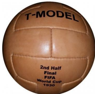
Imagem de referência:

Objetivos: Réplica de bola utilizada no início da prática do futebol no Brasil. Essa bola tem como premissa a costura à mão, o fechamento da câmara interna de ar com cadarço e o revestimento da bola em couro. A instalação da obra estará em uma mesa apropriada para tanto, com uma cavidade circular de encaixe para fixação com 13 cm de diâmetro. A diferença deve estar na composição material do couro e na câmara interna de ar, já de borracha.