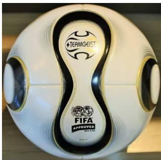
Imagem de referência:

Objetivos: Réplica de bola utilizada no final dos anos 2000. Essa bola tem como premissa a colagem dos painéis que formam a bola, deixando para trás o modelo geométrico de gomos com costura, o fechamento da câmara interna de ar com válvula externa para enchimento e o revestimento da bola em material sintético, já impermeável. A instalação da obra estará em uma mesa apropriada para tanto, com uma cavidade circular de encaixe para fixação com 13 cm de diâmetro. A diferença deve estar na composição material do couro e na câmara interna de ar, já de borracha.