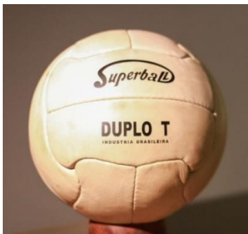
Imagem de referência:

Objetivos: Réplica de bola utilizada nos anos 1950 no Brasil. Essa bola tem como premissa a costura à mão, o fechamento da câmara interna de ar com válvula externa para enchimento e o revestimento da bola em couro, ainda permeável. A instalação da obra estará em uma mesa apropriada para tanto, com uma cavidade circular de encaixe para fixação com 13 cm de diâmetro. A diferença deve estar na composição material do couro e na câmara interna de ar, já de borracha.