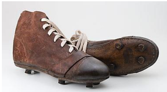
Imagem de referência:

foco na funcionalidade do equipamento. Devido aos materiais utilizados, o peso era maior em comparação aos modelos atuais. A proposta é que a fixação dessa chuteira permita com que o visitante pegue o objeto na mão para sentir seu peso e composição material.