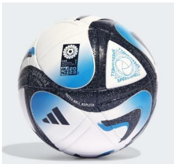
Imagem de referência:

Objetivos: Réplica de bola utilizada no início dos anos 2020. Essa bola tem como premissa a cola e as cores em base de água, o fechamento da câmara interna de ar com válvula externa para enchimento e o revestimento da bola em poliuretano. A instalação da obra estará em uma mesa apropriada para tanto, com uma cavidade circular de encaixe para fixação com 13 cm de diâmetro. A diferença deve estar na composição material do couro e na câmara interna de ar, já de borracha.