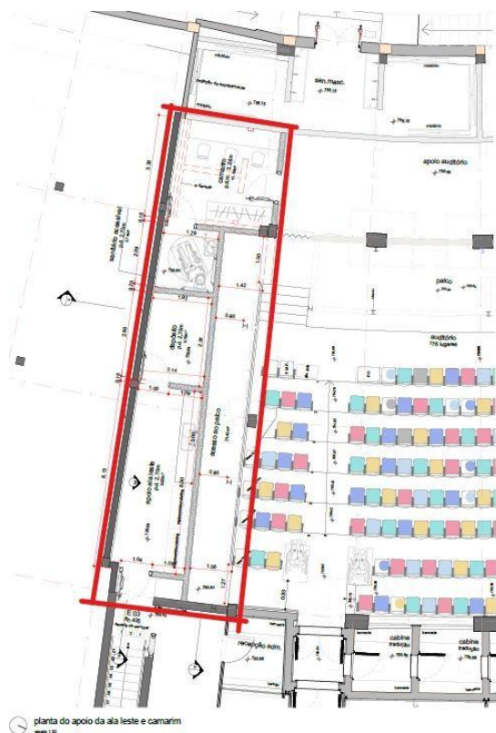
Figura 1 - área de ampliação do auditório

Deverá ser verificado o projeto de ar-condicionado existente, a ser fornecido após a assinatura do contrato, visando avaliar a necessidade de complementação ou intervenção no sistema existente, considerando a alteração do volume de ar da sala com a demolição da parede lateral para o acesso ao palco.