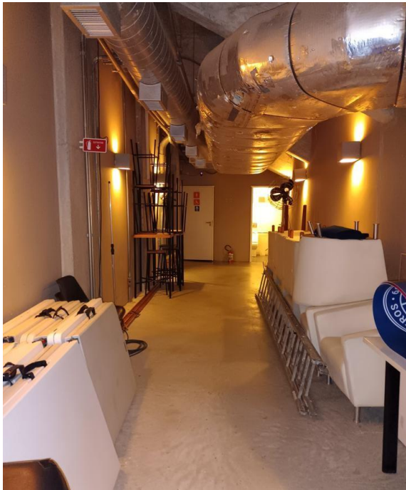
Figura 4 - Vista do corredor atrás do palco com os dutos existentes e sanitários ao fundo, que serão demolidos para adaptação do camarim

Na ala Oeste do museu, temos atualmente uma sala única que será dividida em duas salas menores, sendo uma destinada ao apoio de eventos e a outra sala administrativa. Deverá ser previsto a adequação do sistema existente para o layout proposto. A área de intervenção de arquitetura corresponde a aproximadamente 20m 2 .