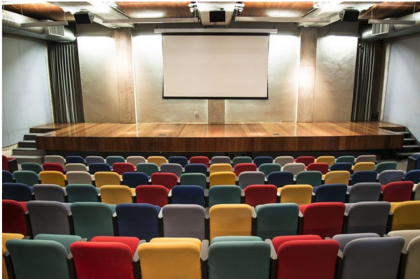
Figura 2 - Vista do palco do Auditório