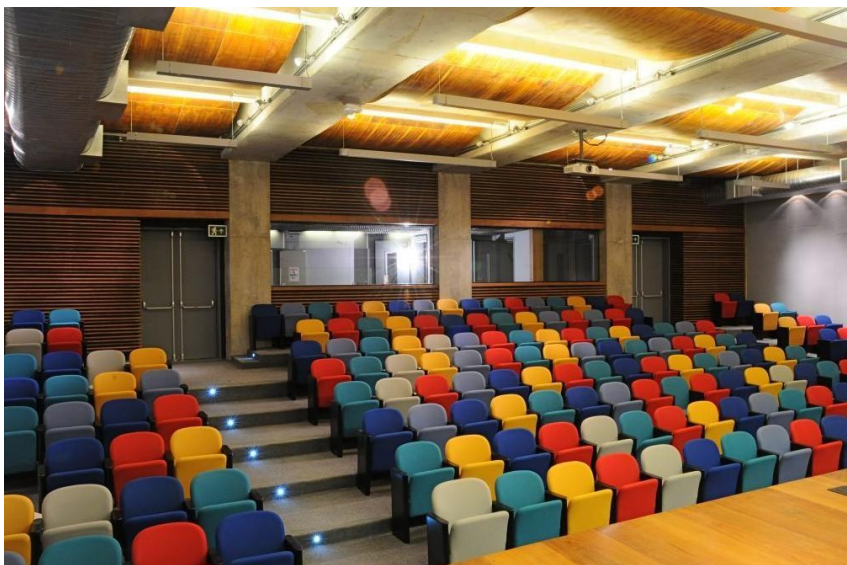
Figura 3 - Vista da plateia do Auditório